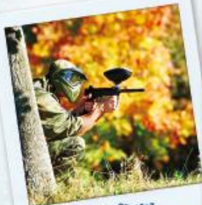
Uczniowie klas 7 SP oraz Gimnazjum wyjazd na PAINTBALL