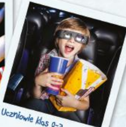
Uczniowie klas 0-3 wyjazd do KINA

oraz całe mnóstwo indywidualnych NAGRÓD NIESPODZIANEK!